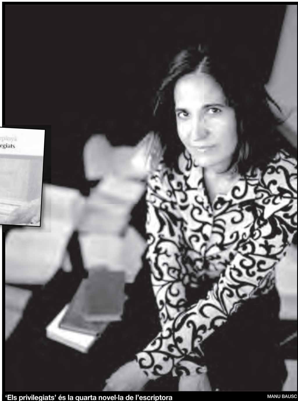
'Els privilegiats' és la quarta novel·la de l'escriptora

La narrativa, el teatre i l'assaig es donen la mà en aquesta novel·la (gènere de gèneres) per bastir un text dens i complex que es pot llegir a molts nivells. Per una banda trobem la peripècia pròpiament narrativa, la vida al museu municipal de Telamós, una ciutat de províncies que degut als canvis polítics es veu catapultada d'una bassa d'oli decimonònica a la globalització postmoderna, postindustrial i multicultural d'un segle XXI amb aparença de monstre mitològic. El Filantròpic, així s'anomena el museu, és un signe d'identitat local fins que el relleu governamental decideix transformar-lo en un signe dels nous temps que s'introdueixen al poble, desestabilitzant els antics